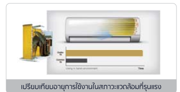
เตรียมเทียบอายุการใช้งานในสภาวะแวดล้อมที่รุนแรง

แผงคอยล์เย็นและคอยล์ร้อนแบบ Golden Fin มีประสิทธิภาพในการระบายความเย็นและความร้อนได้ดี ทำให้เพิ่มประสิทธิภาพการไหลเวียนของสารทำความเย็น มีคุณสมบัติช่วยยืดอายุการใช้งานเครื่องปรับอากาศ สามารถทนต่อฝนกรด ช่วยป้องกันการกัดกร่อนของไอเค็มบริเวณชายทะเลและสารเคมีที่มีฤทธิ์กัดกร่อนอื่นๆ ในย่านโรงงานอุตสาหกรรม ได้มากยิ่งขึ้น