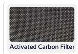
Activated Carbon Filter